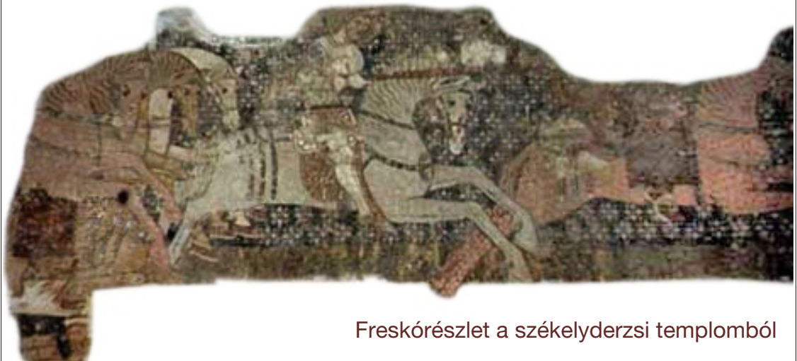
Freskórészlet a székelyderzsi templomból